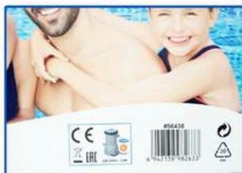
На коробке Bestway