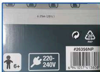
На коробке INTEX